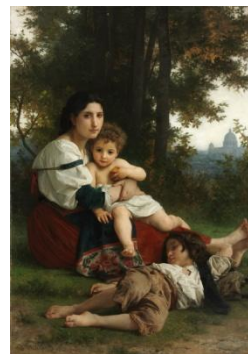
ODPOCZYNEK— BOUGUIEREAU, Wilhelm Adolf (1825, La Rochelle – 1905, La Rochelle) 1879, olejny na płótnie, 164.5x117.8 cm, Muzeum Sztuki, Cleveland

HARTWIG, Julia (1921, Lublin – 2017, Gódków)