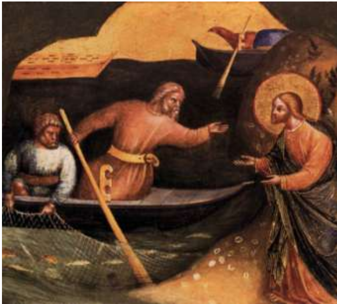
POWOLANIE APOSTOŁÓW PIOTRA I ANDRZEJA — VENEZIANO, Wawrzyniec (mal. 1356-72, Wenecja) ok. 1370, papier topolowy, 24x33 cm, Staatliche Museen, Berlin