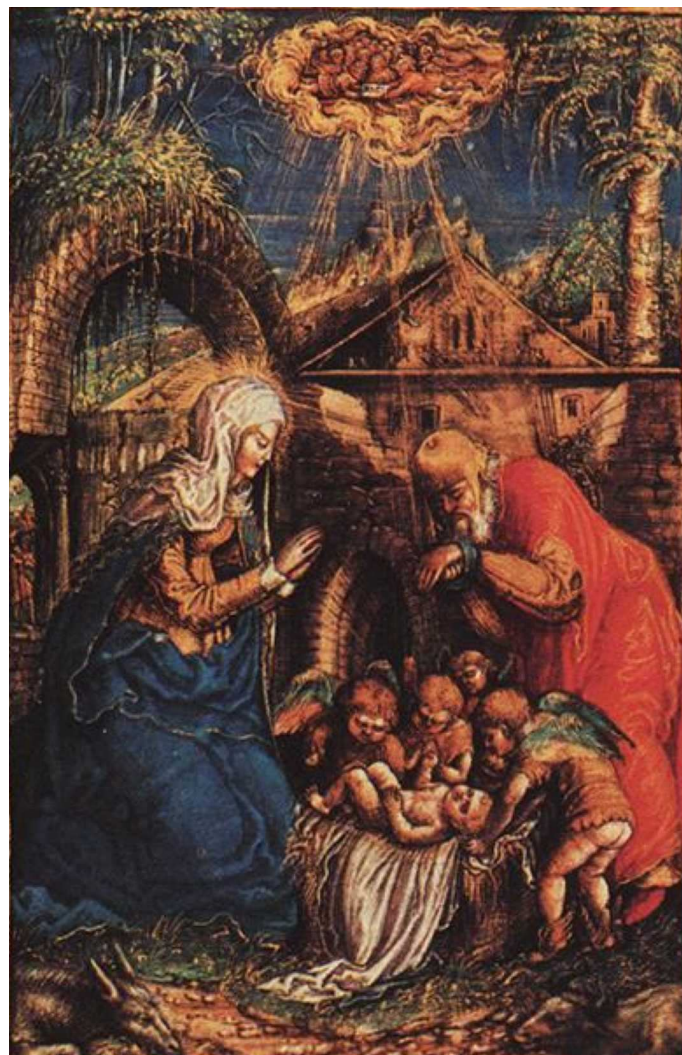
NARODZENIE, SAMOSTRZELNIK, Stanisław (ok. 1480, Kraków - 1541, Mogiła), 1527-28, w modlitewniku królowej Bony, pergamin, Bodleian Library, Oxford

W tych szczególnych, niezwykłych dniach wcielenia Słowa Bożego niech Nowonarodzone Dziecię umocni wiarę skruszy kajdany grzechu i wskaże ścieżkę wiodącą do Pana