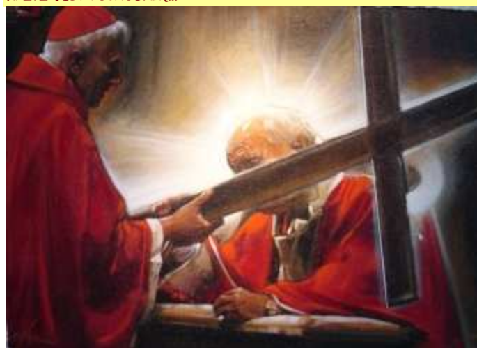
ADORACJA KRZYŻA...

W nocy cierpienia i zabląkania krzyż jest pochodnią, która podtrzymuje oczekiwanie na nowy dzień zmartwychwstania. [...] Boski Królu ukrzyżowany, niech tajemnica Twojej chwalebnej śmierci zatriumfuje w świecie. Spraw, abyśmy nie tracili odwagi i niezłomnej nadziei w obliczu dramatów ludzkości i wszelkich krzywd, które ponizają człowieka, odkupionego Twoją cenną krwią. Spraw, abyśmy [...] z jeszcze głębszym przekonaniem zawołali: Twój krzyż jest zwycięstwem i zbawieniem, „quia per sanctam crucem tuam redemisti mundum” — „boś przez krzyż swój święty świat odkupił racy!”