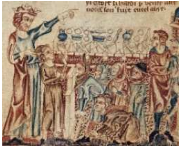
WESELE KRÓLEWSKIE, miniatura, w "Ilustrowana Biblia Holkham", Anglia, ok. 1320-30, British Library, Londyn

Bo wielu jest powołanych, lecz mało wybranych».