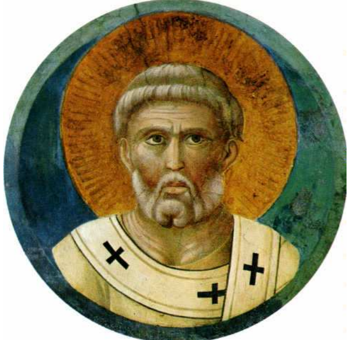
św. Piotr, Giotto, di Bondone (1267, Vespignano - 1337, Florencja), tondo w klasztorze św. Franciszka, Asyż