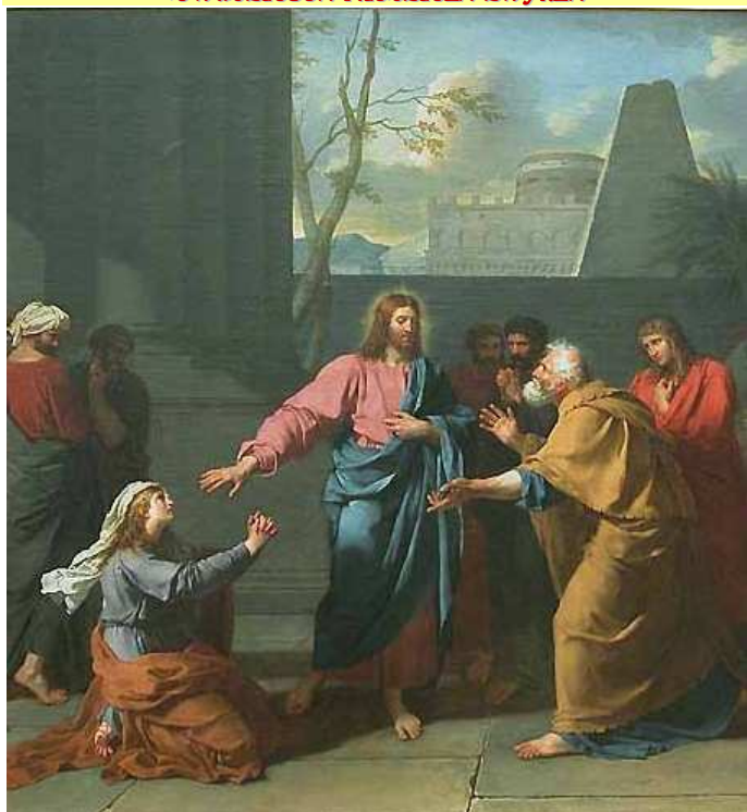
CHRYSZTUS I KOBIETA KANAŃSKA, DROUAI, Jean Germain (1763, Paryż – 1788, Rzym), fragm., 1784, olejny na płótnie, 114x146 cm, Musée du Louvre, Paryż