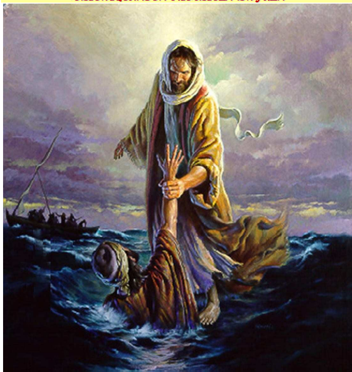
NASZA UCIECZKA I NASZA SIŁA, WEISTLING, Morgan (ur. 1964, USA); źródło: www.lordsart.com