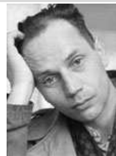
BIAŁOSZEWSKI, Miron (1922, Warszawa – 1883, Warszawa), 1947 fot. źródło: miron.kom.pl