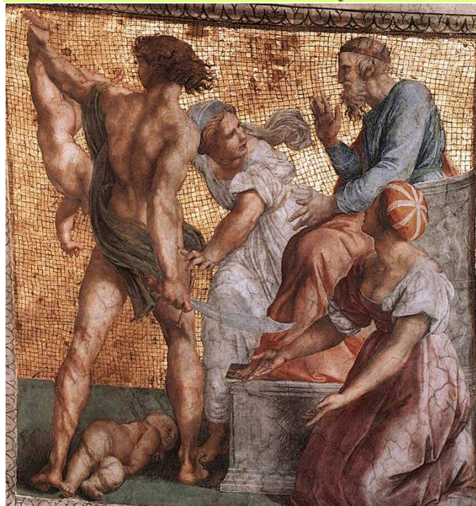
SAD SALOMONA, RAFFAELLO, Sanzio (1483, Urbino -1520, Rzym), 1510-11, fresk, panel na suficie, 120x105 cm, Stanza della Segnatura, Palazzi Pontifici, Watykan