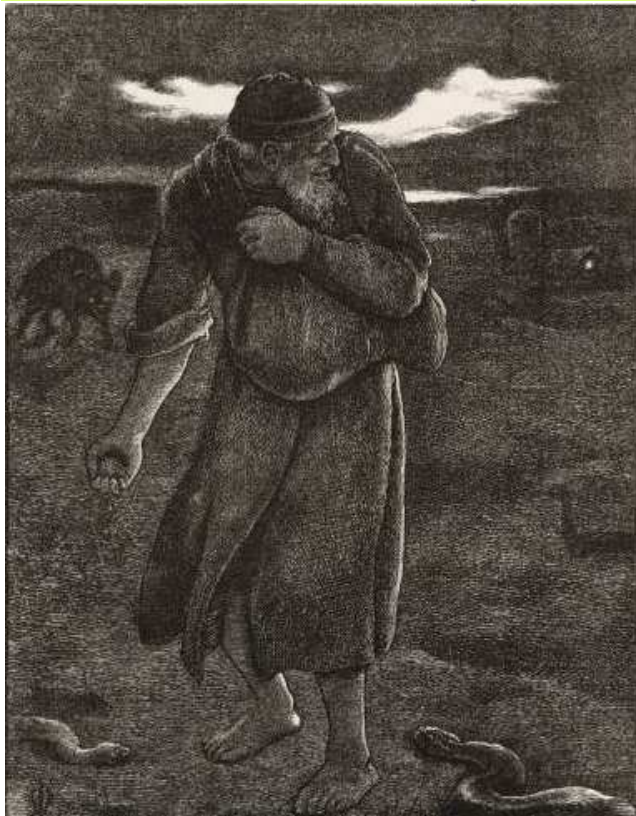
ŚNIECHWASTÓW, MILLAIS, John Everett (1829, Southampton – 1896, Londyn), z Przypowieści naszego Pana, 1864, druk na papierze, 140x108 mm; źródło: www.lata.org.uk