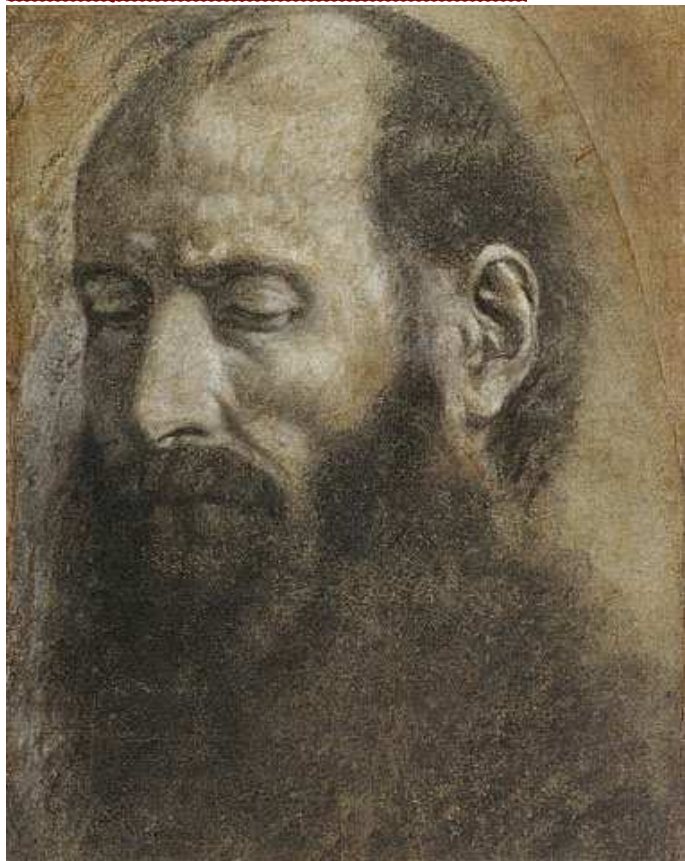
ŚW. PAWEŁ, SAVOLDO, Giovanni Girolamo (1480, Brescia - 1548, Wenecja), 1533, czarna, biała i czerwona kreda na niebieskim papierze, J. Paul Getty Museum, Los Angeles; źródło: www.getty.edu

Bracia: Wy nie żyjecie według ciała, lecz według ducha, jeśli tylko Duch Boży