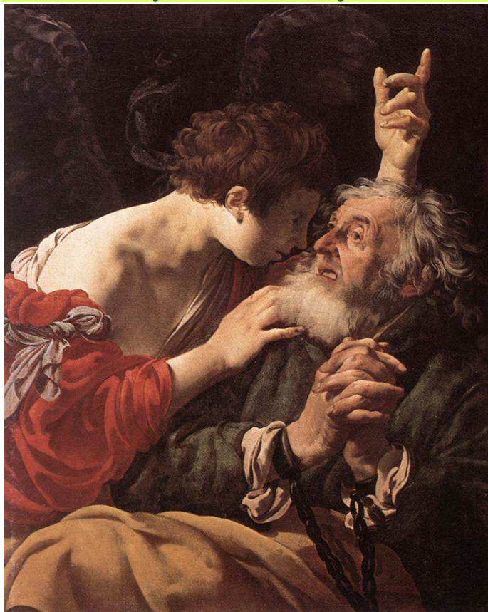
OCALENIE ŚW. PIOTRA, TERBRUGGHEN, Hendrick (1588, Deventer - 1629, Utrecht), olejny na płótnie, Mauritshuis, Haga