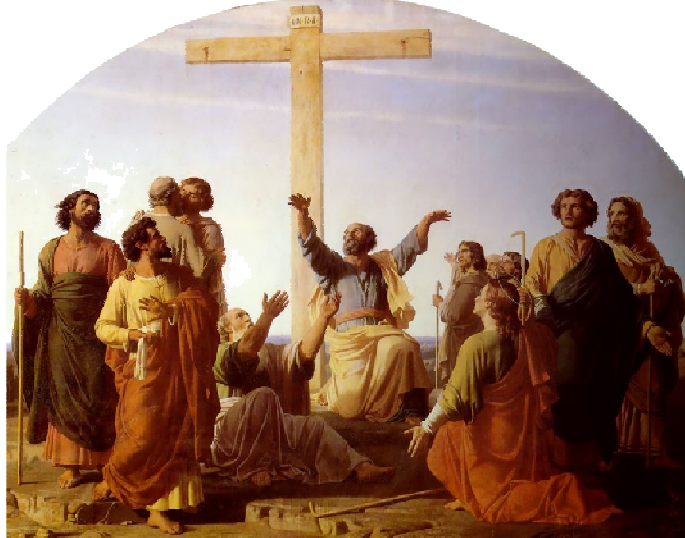
APOSTOŁOWIE WYRUSZAJĄ NA GŁOSZENIE EWANGELII, GLEYRE, Charles (1808, Chevilly - 1874, Paryż), olejny na płótnie, kolekcja prywatna