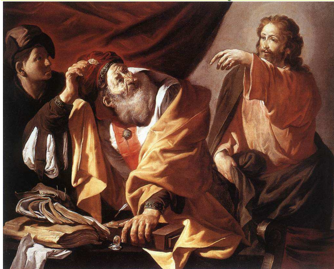
POWOLANIE ŚW. MATEUSZA, TERBRUGGHEN, Hendrick (1588, Deventer - 1629, Utrecht), ok. 1616, olejny na płótnie, 106x128 cm, Muzeum Sztuk Pięknych, Budapeszt; źródło: www.wga.hu