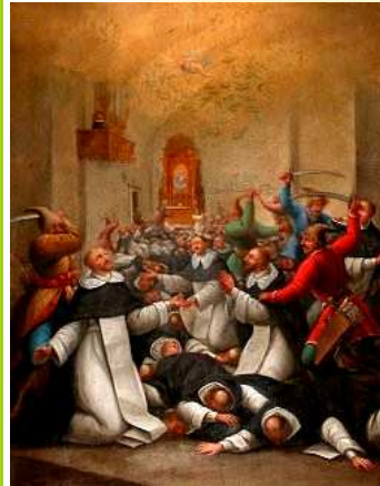
W przeddzień ostatniego napadu wg A. Brahama Bzowskiego (1637), który opierać się miał na "bardzo starożytnych rocznikach i na najstarszych rękopisach" w

Pierwsza historyczna wzmianka umieszcza Sadoka w 1221 w Bolonii, gdzie miała miejsce kapituła generalna zakonu św. Dominika Guzmana. Nie wiadomo, ile miał lat ani skąd pochodził (dalsze jego losy świadczą, że mógł pochodzić z Polski lub Węgier: jeśli z Polski to byłby pierwszym dominikaninem z naszego kraju...). Z Bolonii Dominik wysłał Sadoka na Węgry, do Lorch, dla założenia nowej prowincji. Przez wiele lat głosił Ewangelię pogańskim Kumanom na Węgrzech. Był też przeorem w Zagrzebiu. Jego cicha, wytrwała praca nie utrwaliła się jednakże na kartach historii – wkroczył na jej łamy ponownie dopiero zimą 1259/1260, w Sandomierzu. Jak i kiedy się tam znalazł – nie wiadomo. W 1260 Polska stała się celem drugiego najazdu Tatarów (pierwszy – w 1241). Najeżdźcy zaatakowali Sandomierz i zdobyli go podstępem, wywabiając przywódców na rozmowy pokojowe (ten sam manewr 7 wieków później powtórzyli Sowieci aresztując w 1945 przywódców polskiego państwa podziemnego...). Miasto splądrowano a mieszkańców wyrznięto.