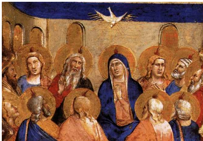
PIĘCZDZIESIĄTICA, GADDI, Taddeo (1300, Florencja - 1366, Florencja), 1335-40, drzewo orzechowe, 35x27 cm, Staatliche Museen, Berlin

Przebywali wtedy w Jerozolimie pobożni Żydzi ze wszystkich narodów pod słońcem. Kiedy więc powstał ów szum, zbiegli się tłumnie i zdumiali, bo każdy słyszał, jak przemawiali w jego własnym języku. Pełni zdumienia i podziwu mówili: „Czyż ci wszyscy, którzy przemawiają, nie są Galilejczykami? Jakżeż więc każdy z nas słyszy swój własny język ojczysty? – Partowie i Medowie, i Elamici, i mieszkańcy Mezopotamii, Judei oraz Kapadocji, Pontu i Azji, Frygii oraz Pamfilii, Egiptu i tych części Libii, które leżą blisko Cyreny, i przybysze z Rzymu, Żydzi oraz prozelici, Kreteńcy i Arabowie – słyszymy ich głoszących w naszych językach wielkie dzieła Boże”.