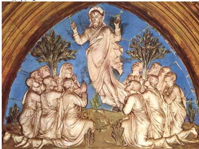
WNIĘBOWSTĄPIENIE, LUCA, della Robbia (1399, Florencja – 1481, Florencja), 1446, glazurowana terakota, katedra (Il Duomo), Florencja

Po tych słowach unosił się w ich obecności w górę i obłok zabrał Go im sprzed oczu. Kiedy uporczywie wpatrywali się w Niego, jak wstępował do nieba, przystąpili do nich dwaj mężowie w białych szatach. I rzekli: »Mężowie z Galilei, dlaczego stoicie i wpatrujecie się w niebo? Ten Jezus, wzięty od was do nieba, przyjdzie tak samo, jak widzieliście Go wstępującego do nieba».