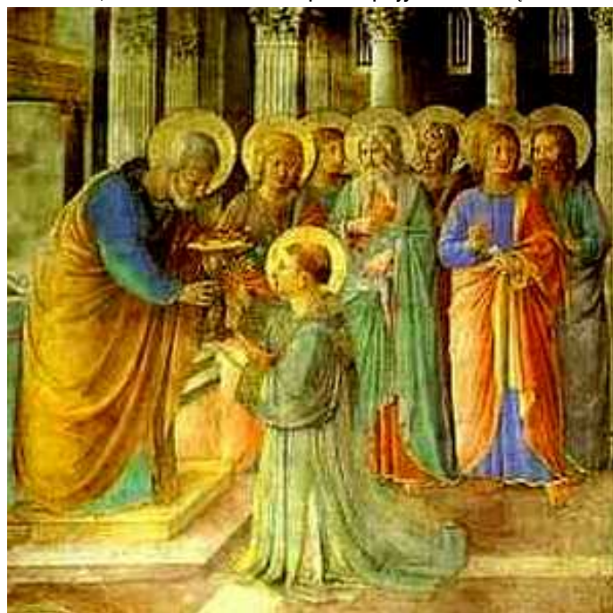
NAMASZCZENIE ŚW. SZCZEPANA, ANGELICO, Fra (ok. 1400, Vicchio nell Mugello - 1455, Rzym), 1447-49, fresk, Cappella Niccolina, Watykan; źródło www.abccgallery.com

A słowo Boże rozszerzało się, wzrastała też bardzo liczba uczniów w Jeruzolimie, a nawet bardzo wielu kapłanów przyjmowało wiarę.