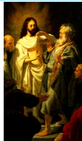
HERBERT, Zbigniew (1924, Lwów - 1998, Warszawa)

il.: NIEWOMERZANIE TOMASZA, Rembrandt, Harmenszoon van Rijn (1606, Leiden - 1669, Amsterdam), fragm., 1634, olejny na desce, 53x51 cm, muzeum Puszkina, Moskwa