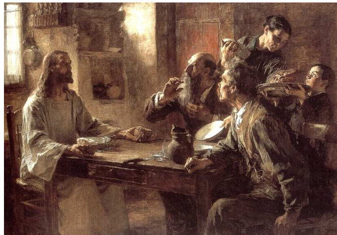
KOLACJA W EMMAS, L'HERMITTE, Léon-Augustin (1844, Mont-Saint-Pere - 1925, Paryż), 1892, olejny na płótnie, 155,5x223 cm, kolekcja prywatna

W tej samej godzinie wybrali się i wrócili do Jerozolimy. Tam zastali zebranych Jedenastu i innych z nimi, którzy im oznajmili: „Pan rzeczywiście zmartwychwstał i ukazał się Szymonowi”. Oni również opowiadali, co ich spotkało w drodze, i jak Go poznali przy łamaniu chleba.