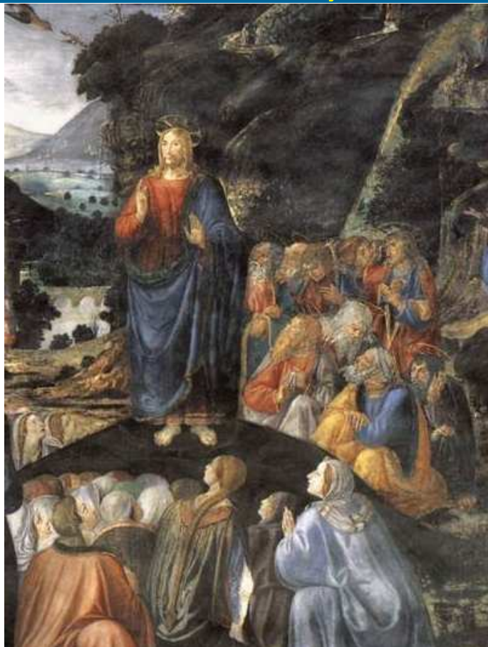
KAZANIE NA GÓRZE, ROSSELLI, Cosimo (1439, Florencja - 1507, Florencja), fragm., 1481-82, fresk, 349x570 cm, kaplica sykstyńska, Watykan