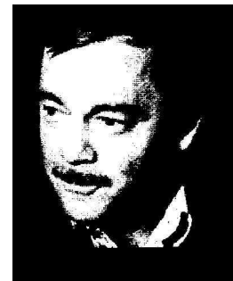
KRYL, Karel (1944, Kroměříž – 1994, Monachium)

Dziękuję Za słodycz zasypiania Dziękuję za zmęczenie Dziękuję Za rzeki wodospady Za jasny blask płomieni Dziękuję dziękuję dziękuję Dziękuję Dziękuję za pragnienie Co tak słabości blisko Dziękuję Dziękuję za cierpienie Co uszlachetnia wszystko Za to że kochać chcę Choć lęk to budzi we mnie