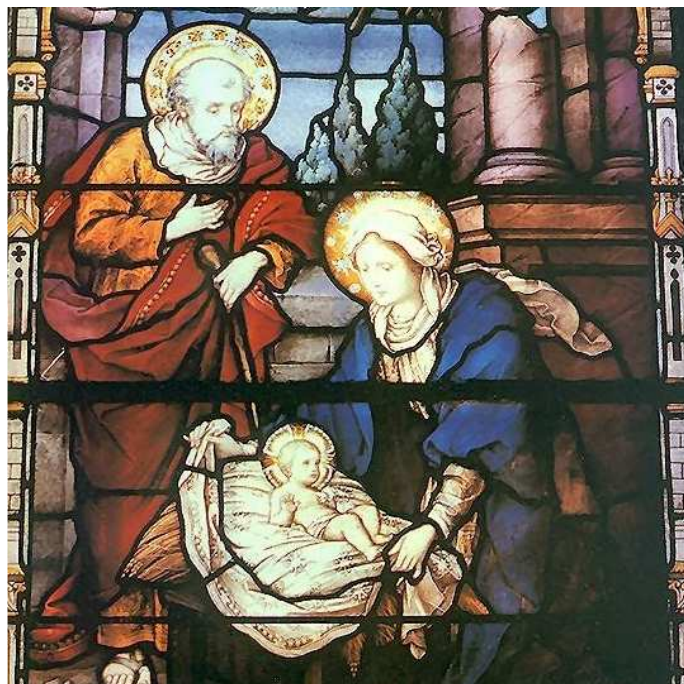
NARODZINY JEZUSA, MEHOFFER, Józef (1869, Ropczyce – 1946, Wadowice), witraż, fragm., Katedra Łacińska, Lwów

LECHOŃ, Jan (1899, Warszawa – 1959, Nowy Jork)