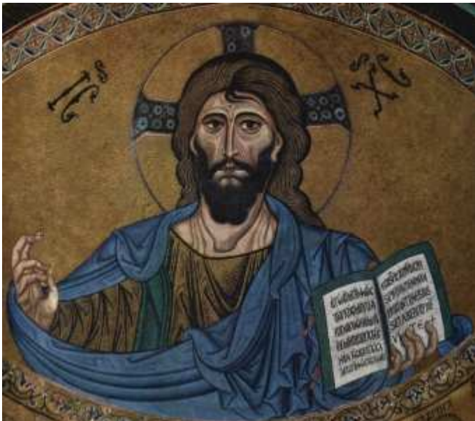
PANTOKRATOR – BOSKI SĘDZIA, ok. 1150, mozaika wykonana na polecenie króla normarskiego Rogera I, katedra w Cefalu, Sycylia; Księga otwarta jest na słowach Chrystusa »Ja jestem światłością świata. Kto idzie za Mną, nie będzie chodził w ciemności, lecz będzie miał światło życia« J 1,9,12

Ze względu na dom Pana, Boga naszego, modlę się o dobro dla ciebie.