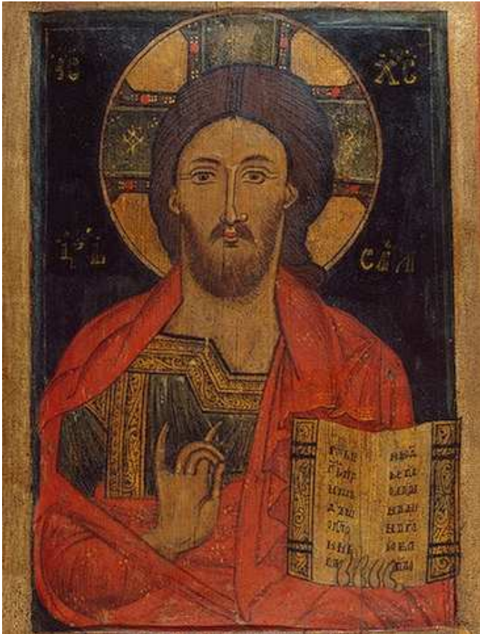
CHRYSTUS PANTOKRATOR, nieznanymi pisarzami ikon cerkwi Eliasza w Wiazieniu nad rzeką Onega, XIII-XIVw., tempera na panelu, 64,5x41,5 cm, Erymita, Sankt Petersburg