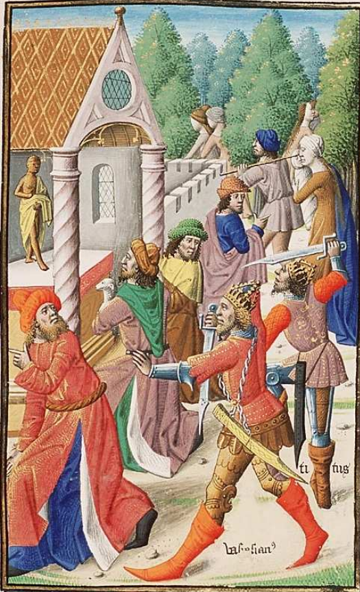
MASAKRA ŻYDÓW PRZEZ TYTUSA I WESPASJANA, MATHIE, François (młoty 2 poł. XVI w.), ok. 1475-80, miniatura, 120-80 mm, w "Miasto Boga" św. Augustyna, księga 6, 11. Upadek Jeruzolimy, Museum Meermanno Westreenanum, Haga; źródło collected.net/museum/