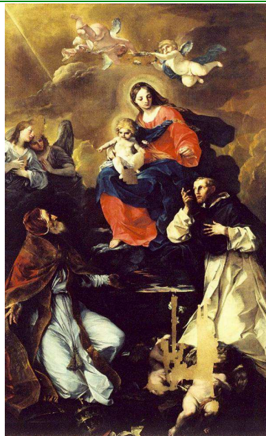
il.: DZIEWICA Z DZIECIEM WRĘCZAJĄCA RÓŻANIEC ŚW. DOMINIKOWI (po lewej Pius V), TORELLI, Felice (1667, Werona - 1748, Bolonia), ok. 1700, olejny na płótnie, Chiesa del Suffragio, Fano

Domingo de Guzman był hiszpańskim kaznodzieją. W czasie szerzenia się herezji Albigensów udał się do południowej Francji. Albigensi, wyznający odmianę manicheizmu, uznawali zdradę, cudzołóstwo i samobójstwo za czyny cnotliwe, wierzyli, że nie ma nieba ni piekła, nie istnieją zasady moralne. Na płaszczyźnie wiary - była to herezja; na płaszczyźnie politycznej - podważanie fundamentów społeczeństwa średniowiecznego. Początkowo nie odnosił wielkich sukcesów. Zmieniło się to w 1208, gdy podczas kazania w kaplicy w Prouille, w samym sercu herezji, objawić mu się miała Maryja i wręczyła różaniec, nalegając by - jako zadośćuczynienie za grzechy - uczył tej Modlitwy wszystkich ludzi. Maryja miała powiedzieć: „Nie dziw się, że twoja praca przynosi tak małe owoce, bowiem ziemia ta jest nieplodną, nie zroszona jeszcze kroplami Bożej łaski. Gdy Bóg zdecydował się odnowić oblicze ziemi zaczął od zesłania obfitego deszczu Pozdrowienia Anielskiego. Głoś zatem mój Psalterz składający się ze 150 Zdrowaś Mario i 15 Ojciec nasz,