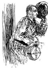
il.: STANISŁAW BALIŃSKI, TOPOLSKI, Feliks (1907, Warszawa – 1989, Londyn)

I dalej za nią gonią po łądach, po zmierzchach. I dalej znoszą dla niej, pod niebem nieszczęścia. Śmiertelny chłód wygnania na mongolskich mrozach. I w nowe idą piekło, zaciskając pięści, Na dno upodleń ludzkich w niemieckich obozach. I dalej o nią walczą na Norwegii śniegach, I na piaskach Egiptu w rozpalonym wietrze, Umierają samotnie w galijskich szeregach, I w Anglji, wiecznie wolnej, wznoszą się w powietrze. Wszystko dla niej poświęca i zniosą w milczeniu Naprzekór wielkim próbom, które los przynosi, A ona, ranna w serce, bezbronna w cierpieniu, Niczego od nich nie chce i o nic nie prosi. Tylko czasami nocą, gdy rozpacz opada, I gdy Szopen, jak widmo, gra im na pianinie, Zjawia się, cała w czerni, staje przy nim błada, I śpiewa do nich cicho - że jest, że nie zginie.