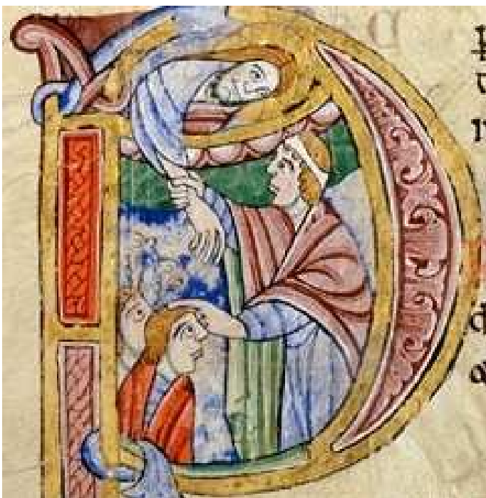
PODAJ PANIE PRAWĄ RĘKĘ TWOJEJ NIEBIAŃSKIEJ POMOCY SWOIM SŁUGOM, nieznany ilustrator „Psalterza św. Albana”, miniatura, Anglia, 1 sta poł. XIIw., Uniwersytet Aberdeen, Historic Collections

A ja w sprawiedliwości ujrzę Twe oblicze, ze snu powstając nasycę się Twym widokiem.