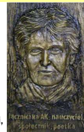
kapliczka AK. nauczyciel, społecznik, poeta

Do samej śmierci, od narodzin sprawdza się człowiek w krótkim - jest.