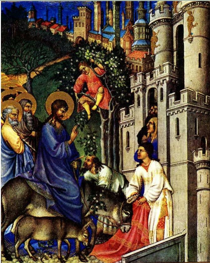
WJAZD DO JEROZOLIMY, bracia LIMBOURG (XIV-XVw., Nijmegen), przed 1416, ilustracja w manuskrypcie Les Très Riches Heures du Duc de Berry, folio 173v, Musée Condé, Chantilly