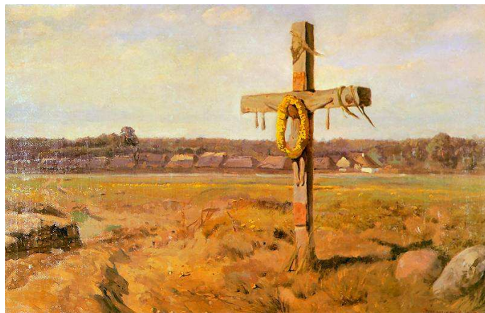
KRZYŻ, CHELMŃSKI, Józef (1849, Boczek k. Łowicza - 1914, Kuklówka k. Grodziska Maz.), 1905, olej na płótnie, 79x122 cm, Muzeum Mazowieckie w Płocku

FRYCKOWSKI, Jerzy (ur. 1957, Gorzów Wielkopolski)