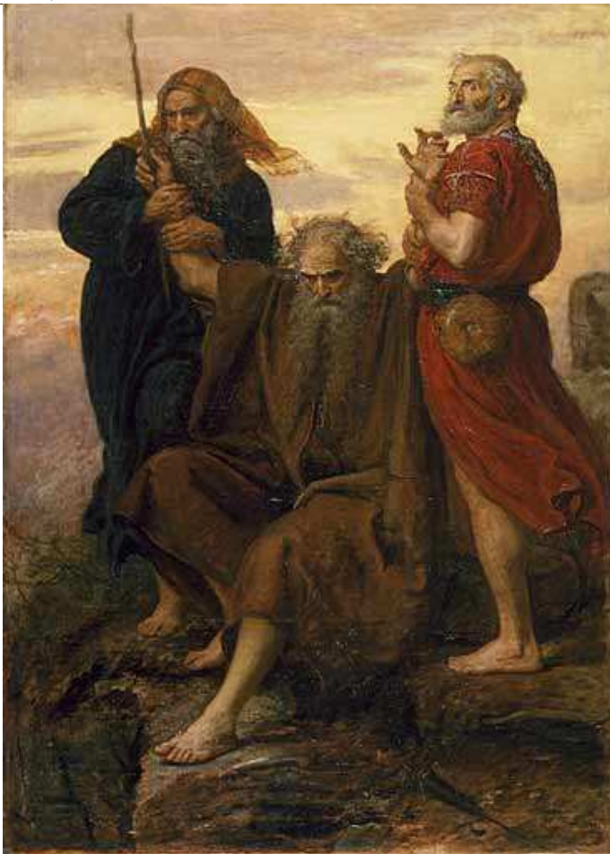
ZWYCIĘSTWO, PANIE!, MILLAIS, John Everett (1829, Southampton – 1896, Londyn), 1871, olejny na płótnie, Manchester City Galleries

Amalekici przybyli, aby walczyć z Izraelitami w Refidim.