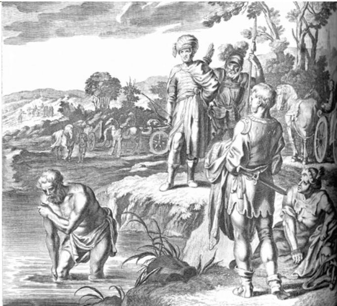
NAAMAN ZANURZAJĄCY SIĘ W JORDANIE POD OKIEM PROROKA ELIZEUSA. SCHEITS, Matthias (ok. 1630, Hamburg - 1700, Hamburg), 1672, rycina, a "Biblia, das ist Die ganze H. Schrift Alten und Newen Testaments, Deutsch"; źródło www.pilts.emory.edu

Z DRUGIEJ KSIĘGI KRÓLEWSKIEJ 2 Krl 5,14-17