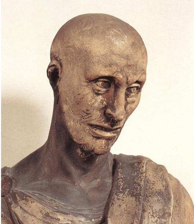
PROROK HABAKUK, DONATELLO/Donato di Niccolò di Betto Bardi/ (ok. 1386, Florencja - 1466, Florencja), szczegół, 1423-25, marmur, Museo dell'Opera del Duomo, Florencja; źródło gallery.euroweb.hu

Z KSIĘGI PROROKA HABAKUKA Ha 1,2-3;2,2-4