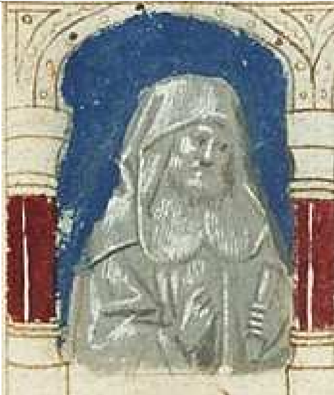
PROROK AMOS, HESDIN z Amiens, ok. 1450-55, iluminacja z "Biblia Pauperum" (Biblia ubogich), Museum Meermanno Westreenianum, Haga

Słuchajcie tego wy, którzy gnębicie ubożego i bezrolnego pozostawiacie bez pracy, którzy mówicie: „Kiedyż minie nów księżycy, byśmy mogli sprzedawać zboże? Kiedyż szabat, byśmy mogli otworzyć spichlerz? A będziemy zmniejszać efe, powiększać syki i wagę podstępnie fałszować. Będziemy kupować biednego za srebro, a ubożego za parę sandałów i plewy pszenicy będziemy sprzedawać”.