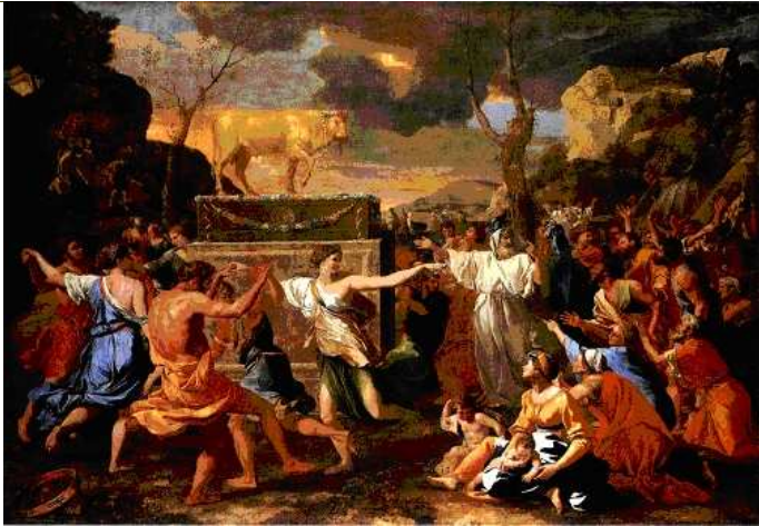
ADORACJA ZŁOTEGO CIELCA, Poussin, Nicolas (1594, Les Andelys - 1665, Rzym), ok. 1634, olejny na płótnie rozpiętym na desce, 154 x 214 cm, National Gallery, Londyn

Gdy Mojżesz przebywał na górze Synaj, Bóg rzekł do niego: »Zstąp na dół, bo sprzeniewierzył się lud twój, który wyprowadziłeś z ziemi egipskiej. Bardzo szybko odwrócili się od drogi, którą im nakazałem, i utworzyli sobie posąg cielca ulany z metalu, i oddali mu pokłon, i złożyli mu ofiary, mówiąc: 'Izraelu, oto twój bóg, który cię wyprowadził z ziemi egipskiej'«.