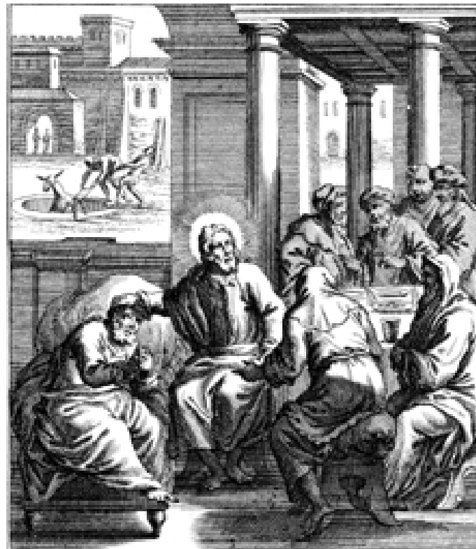
SZABAT, WEIGEL, Johann Christoph (1654, Redwitz – 1725, Norymberga), z "Biblia egypta: Bildnissen auss Heiliger Schrift Alt und Neuen Testaments", 1695, drzeworyt

Deszcz obfity zesłałeś, Boże, Tyś orzeźwił swoje znużone dziedzictwo. Twoja rodzina, Boże, znalazła to mieszkanie, które w swej dobroci dałeś ubogiemu.