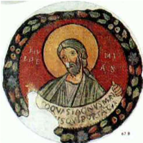
PROROK JEREMIASZ, fresk, szkoła rzymska, ok. 1120, Muzeum Watykańskie

Rozkazał król Ruszycie Ebedmelekowi: „Weź sobie stąd trzech ludzi i wyciągnij proroka Jeremiasza z cysterny, zanim umrze!”