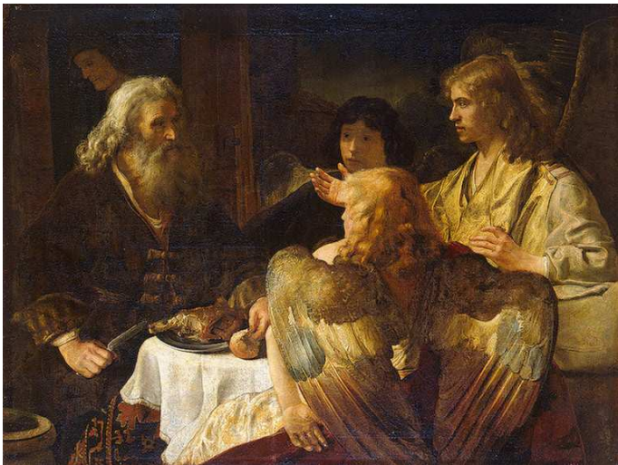
ABRAHAM I TRZEJ ANIOŁOWIE, REMBRANDT, Harmenszoon van Rijn (1606, Leiden - 1669, Amsterdam) lub VICTORS, Jan (ok. 1620, Amsterdam - 1676, Wschodnie Indie), ok. 1640, olejny na płótnie, 121x162 cm, Erymitaż, Sankt Petersburg

Dusza nasza oczekuje Pana. On jest naszą pomocą i tarczą. Panie, niech nas ogarnie Twoja łaska, według nadziei, którą pokładamy w Tobie.