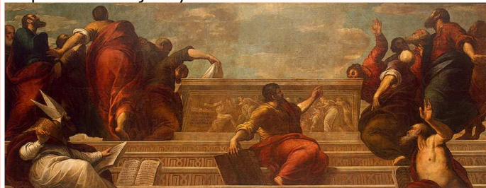
APOSTOŁOWIE U GROBU DZIEWICY, PALMA, Jacopo, il giovane (1544, Weneja - 1626, Weneja), ok. 1582, olejny na płótnie, 349x880 cm, Ermitaż, Sankt Petersburg; źródło www.hermitagemuseum.org