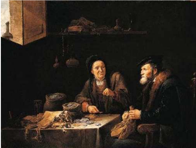
CHCIWY MĘCZYZNA, TENIERS, Dawid, młodszy (1610, Antwerpia - 1690, Bruksela), 1648, olejny na płótnie, 62.5x85 cm, National Gallery, Londyn