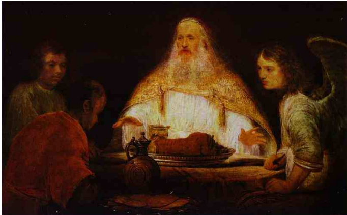
ABRAHAM I ANIOŁOWIE, GELDER, Aert de (1645, Dordrecht – 1727, Dordrecht), olejny na płótnie, Museum Boymans-van Beuningen, Rotterdam

"Gdy Jezus przebywał w jakimś miejscu na modlitwie i skończył ją, rzekł jeden z uczniów do Niego: Panie, naucz nas modlić się" Lk 11, 1 . Czyż to nie z kontemplacji modlącego się Nauczyciela rodzi się w uczniu Chrystusa pragnienie modlitwy? Może więc nauczyć się jej od Nauczyciela modlitwy. 2765 Właśnie kontemplując i słuchając Syna, dzieci uczą się modlić do Ojca. [KKK, 2601]