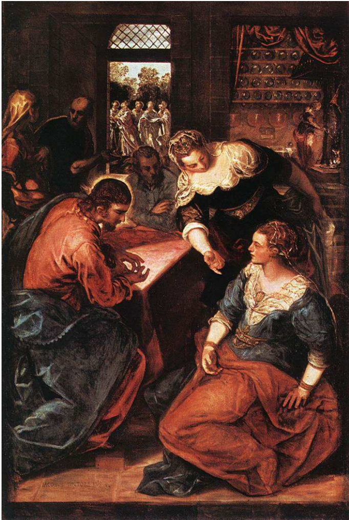
CHRYSZTUS W DOMU MARTY I MARII. TINTORETTO, Jacopo, Robusti (1518, Wenecja - 1594, Wenecja), 1570-75, olejny na płótnie, 200x132 cm, Alte Pinakothek, Monachium

Bóg daje ludziom możliwość dobrowolnego uczestniczenia w swojej Opatrzności, powierzając im odpowiedzialność za czynienie sobie ziemi "poddaną" 106, 373 i za panowanie nad nią 140 Por. Rdz 1, 26-28. Bóg pozwala więc ludziom być rozumnymi 1954 2427 i wolnymi przyczynami w celu dopełnienia dzieła stworzenia, w doskonałej harmonii dla dobra własnego i dobra Innych. Ludzie, często nieświadomi współpracownicy woli Bożej, mogą wejść w sposób dobrowolny w Boży zamysł 2738 przez swoje działania, przez swoje modlitwy, a także przez swoje cierpienia 141 Por. Kol 1, 24. 618, 1505 Stają się więc w pełni "pomocnikami Boga" 1 Kor 3, 9; 1 Tes 3, 2 i Jego Królestwa 142 Por. Kol 4, 11. [KKK, 307]