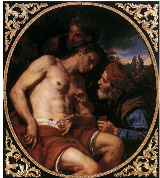
DOBRY SAMARYTANIN, LOTH, Johann Karl (1632, Monachium - 1698, Weneja), ok. 1676, olej na płótnie, 125x108 cm, Kunstsammlungen Graf von Schönborn, Pommerfelden

On odpowiedział: „Ten, który mu okazał miłosierdzie”. Jezus mu rzekł: »Idź, i ty czyn podobnie».