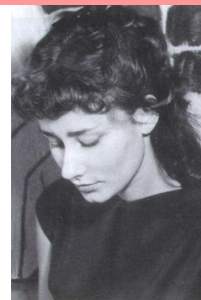
POŚWIATOWSKA, Halina (1935, Częstochowa - 1967, Warszawa), 1966, z tomiku "Oda do rąk"

lekko - żeby nie pognieść skrzydeł tchnij we mnie ptaka o głosie srebrnym z tklivości