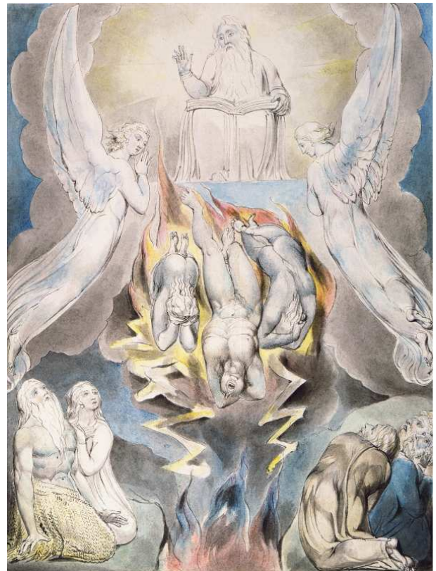
UPADEK SZATANA. BLAKE, William (1757, Londyn) - 1827, Londyn), ok. 1805-06, farby wodne, 23-28cm, w. „Księga Hobza”, wydanie Butta, Pierpont Morgan Library, Nowy Jork

Wtedy rzekł do nich: »Widziałem szatana spadającego z nieba jak błyskawica. Oto dałem wam władzę stąpania po wężach i skorpionach, i po całej potędze przeciwnika, a nic wam nie zaszkodzi. Jednak nie z tego się cieszcie, że duchy się wam poddają, lecz cieszcie się, że wasze imiona zapisane są w niebie«.