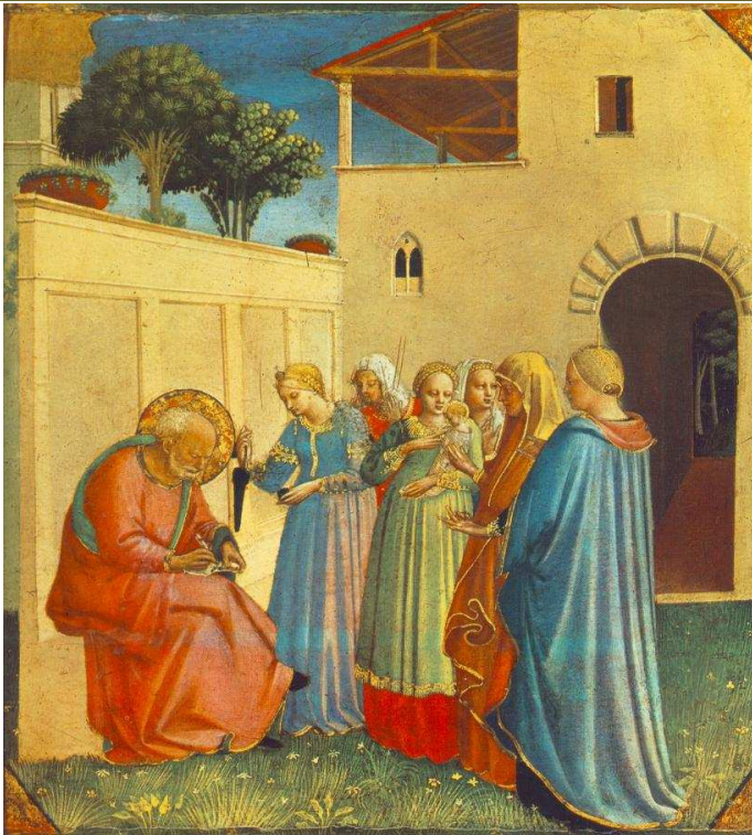
NADANIE IMIENIA JANOWI, ANGELICO, Fra (ok. 1400, Vicchio nell Mugello - 1455, Rzym), 1434-35, tempera na panelu, 26x24 cm, Museo di San Marco, Florencja