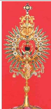
ii. MONSTRANCJA Z RELIKWIARZEM CUDOWNEJ KRWI, 1721, szkoła augsburska, Ludbreg