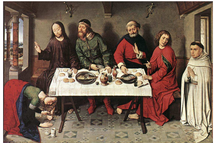
CHRYSTUS W DOMU SZYMONA FARYZEUSZA, BOUTS, Dieric Starszy (ok. 1415, Haarlem - 1475, Leuven), lata 1440-te, olejny na desce, 40,5x61 cm, Staatliche Museen, Berlin

Następnie wędrował przez miasta i wsie, nauczając i głosząc Ewangelię o królestwie Bożym. A było z Nim Dwunastu oraz kilka kobiet, które uwolnił od złych duchów i od słabości: Maria, zwana Magdaleną, którą opuściło siedem złych duchów; Joanna, żona Chuzy, zarządcy u Heroda; Zuzanna i wiele innych, które im usługiwały ze swego mienia.