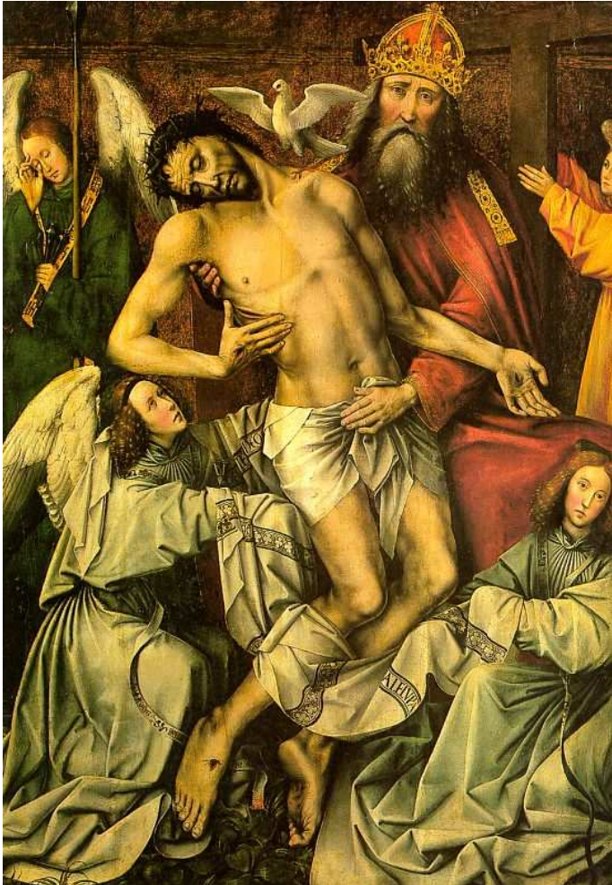
TRÓJCA ŚWIĘTA Z MARTWYM CHRYSZTUSEM PODTRZYMYWANYM PRZEZ ANIOŁY. COTER, Colijn de (ok. 1446, Bruksela - 1538, Bruksela), 1510-15, centralny panel tryptyku Tron łaski, olejny na desce, 118x167cm, Musée du Louvre, Paryż