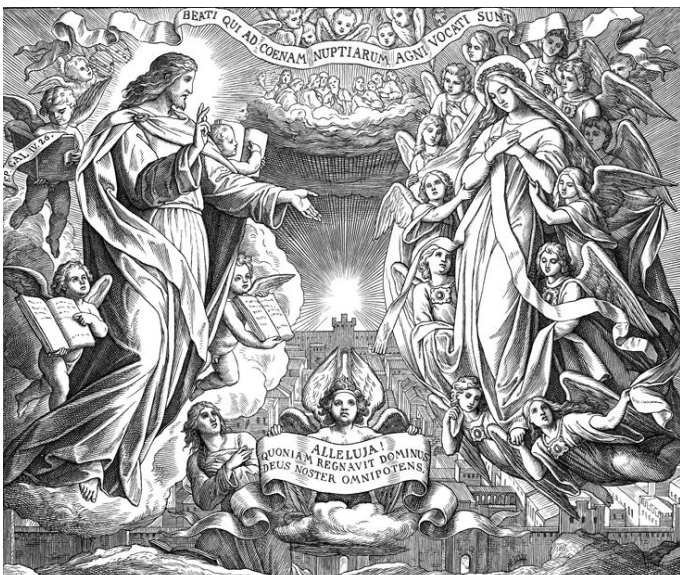
JERUZALEM ZSTĘPUJĄCE Z NIEBA, CARLSFELD, Julius Schnorr von (1794, Lipsk - 1872, Drezno), 1851- 60, rycina, z "Bibel in Bildern"

Z KSIĘGI APOKALIPSY ŚW. JANA APOSTOŁA Ap 21,10-14.22-23