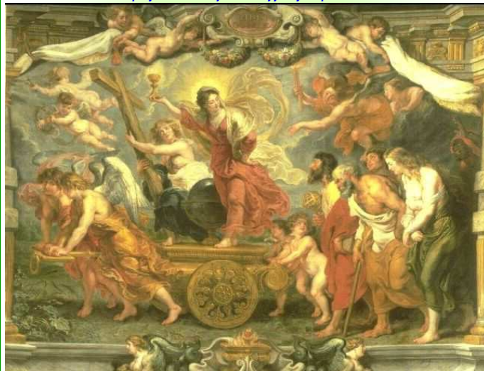
TRIOF EUCHARYSTII NAD FILOZOFIA I NAUKA, RUBENS, Pieter Pauwel (1577, Siegen - 1640, Antwerpia), ~1626, olejny na płótnie, 474x594 cm, Musee des beaux-arts, Valenciennes

Nikt nie przychodzi do Ojca inaczej jak tylko przeze Mnie! 14, 6