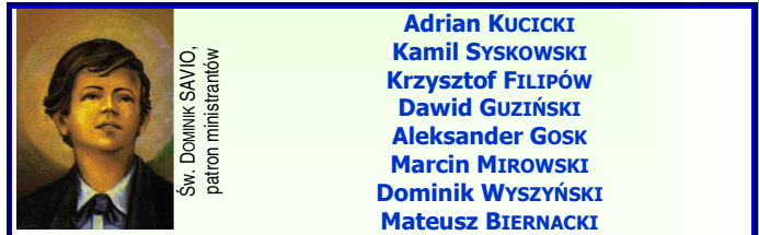
Św. DOMINIK SAVIO, patron ministrantów

2.v.2007 do grona ministrantów przyjęci zostali: