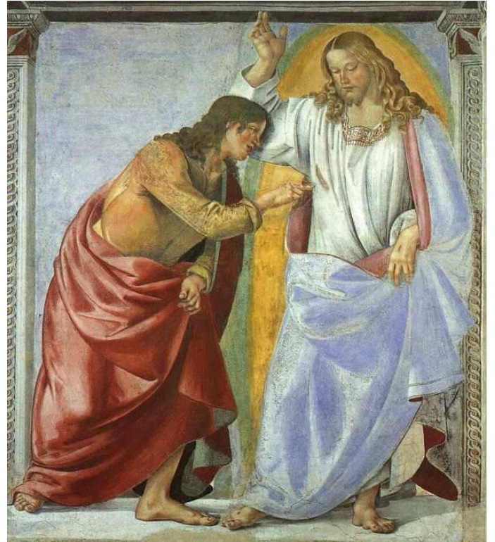
NIEMIERNY TOMASZ, SIGNORELLI, Luca (ok. 1450, Cortona - 1523, Cortona), 1479?, fresk, bazylika w Loreto

wobec uczniów. Te zaś zapisano, abyście wierzyli, że Jezus jest Mesjaszem, Synem Bożym, i abyście wierząc, mieli życie w imię Jego.