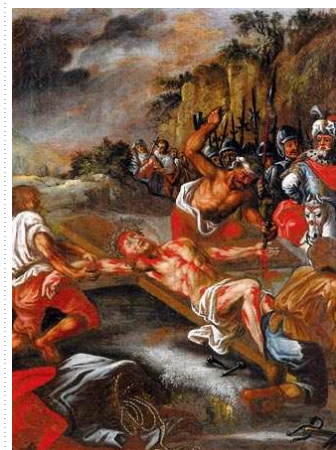
Minał Nero, jak mija burza, wicher, pożar, wojna lub mór... (a krzyż Chrystusa) panuje z wyżyn watykańskich miastu i światu. por. H. Sienkiewicz, Quo vadis, Epilog

Spod krzyża widać dalej. Widać cały świat i tyle ludzkich krzyżów: w Grabarce, w Szawlach, w Katyniu i Miednoje, w Ankonie, na Monte Cassino, na Palmirach i w Loreto. w Gdańsku i na Giewoncie. To nie krzyż się chwieje, to świat się chwieje! S. Kard. Wyszyński