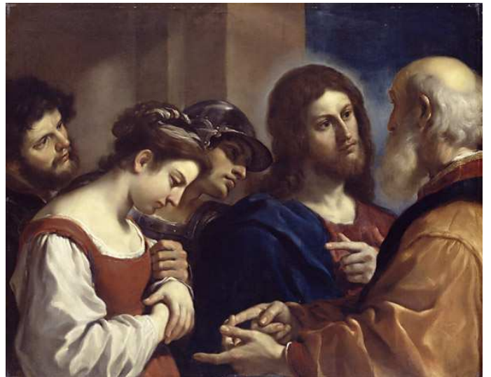
CHRYSTUS I CUDZOŁOŹNICA, GUERCINO (BARBIERI, Giovanni Francesco) (1591, Cento - 1666, Bologna), 1621, olejny na płótnie, 98.2x122.7 cm, Dulwich Art Gallery

Wówczas Jezus, podniósłszy się, rzekł do niej: »Niewiasto, gdzież oni są? Nikt cię nie potępił?«. A ona odrzekła: „Nikt, Panie!”. Rzekł do niej Jezus: »I Ja ciebie nie potępiam. - Idź, a od tej chwili już nie grzesz«.