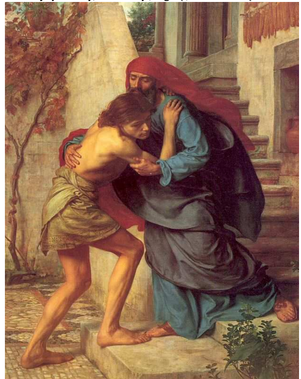
POWRÓT SYNA MARNOTRAWNEGO, POWYTER, Edward John (1836, Paryż - 1919, Londyn), 1869, olejny na płótnie, 92x121,2cm, kolekcja czasopiśmnia Forbes, Nowy Jork, USA

Lecz on mu odpowiedział: 'Moje dziecko, ty zawsze jesteś przy mnie i wszystko moje do ciebie należy. A trzeba się weselić i cieszyć z tego, że ten brat twój był umarły, a znowu ożył; zaginał, a odnalazł się'.