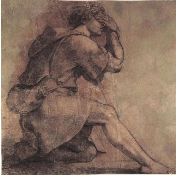
MOJESZ PRZED KRZAKIEM GOREJĄCYM, RAFFAELLO, SANZIO (1483, Urbino -1520, Rzym), ok. 1514, szkic, węgiel, papier na płótnie, 140x138 cm, Museo e Gallerie Nazionali di Capodimonte, Neapol